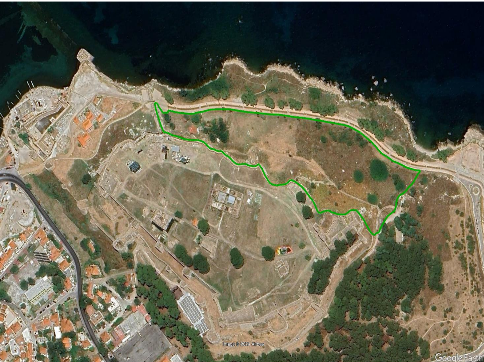
Περιοχή Αι Γιάννη Πρόδρομου - 26.592τ.μ