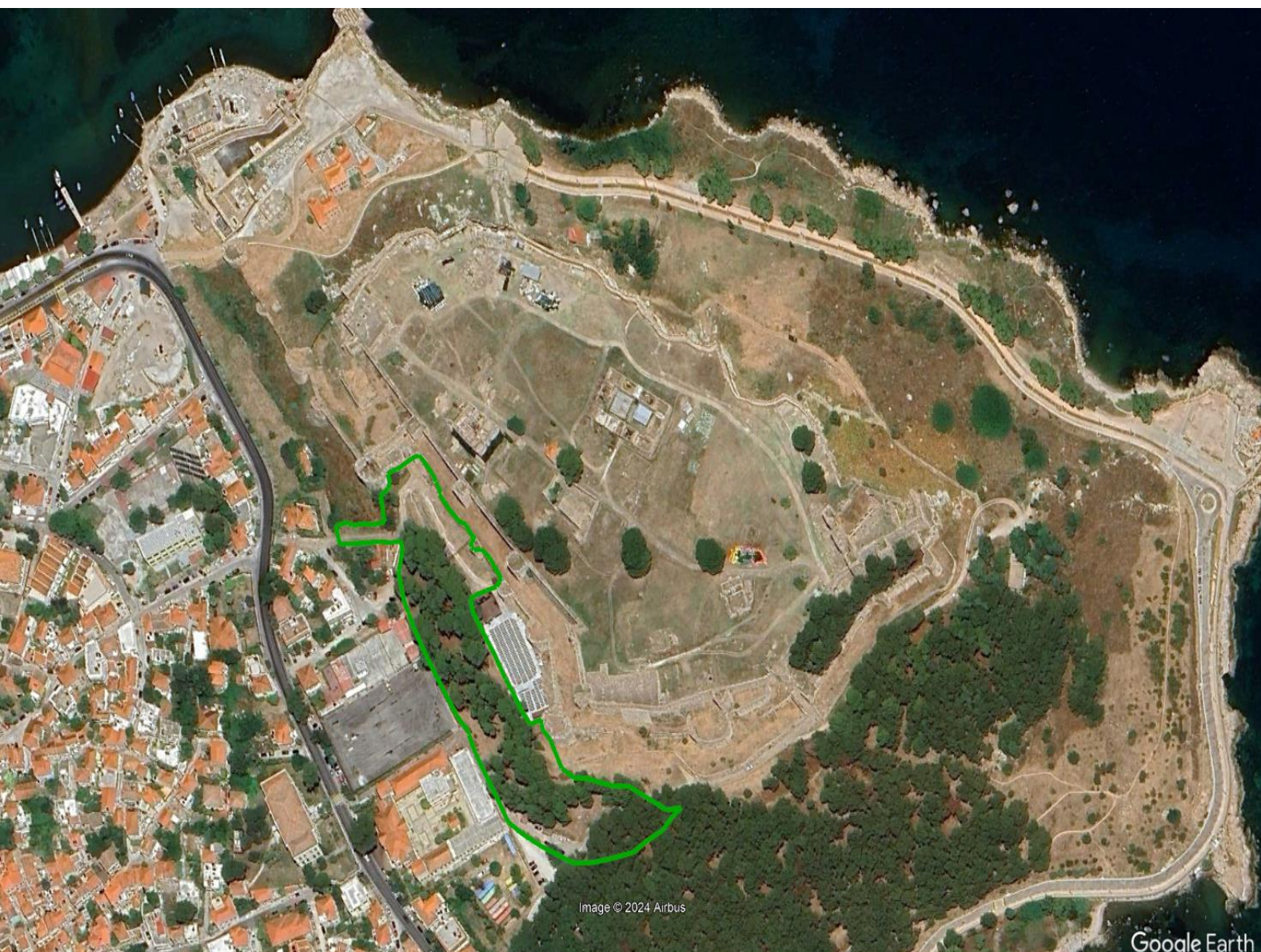
Περιοχή τάφρου μεταξύ Πάνω Κάστρου και Χώρου Εκδηλώσεων Δήμου - 11.365τ.μ